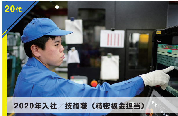
2020年入社 / 技術職 (精密板金担当)