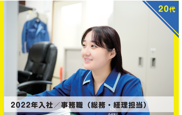
2022年入社 / 事務職 (総務・経理担当)